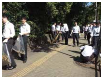
拡大クリーンアイチデー