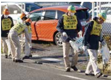
会社近隣道路クリーン作戦

地域美化を目指した「会社近隣道路クリーン作戦」を隔月で実施しているほか、2009年から毎年10月の「CSR月間」に合わせて、「拡大クリーンアイチデー」を国内・海外の子会社を含めて開催しています。