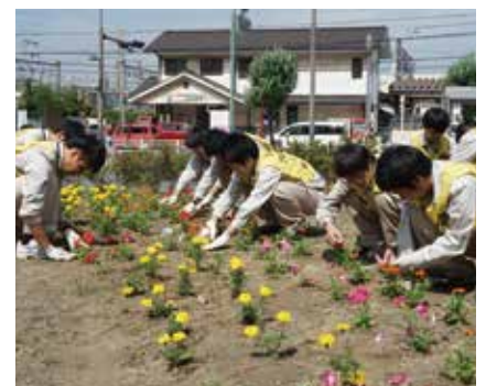
▲ 学園生による聚楽園駅前ロータリー植栽

会社周辺地域の美化活動の一環として、当社本社の最寄り駅である名古屋鉄道聚楽園駅の駅前ロータリーにおいて、毎年2回、花の植え替えを技術学園生が行っています。