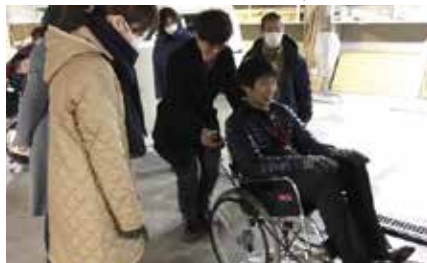
▲ボランティア・福祉体験教室