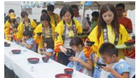
▲社内イベントでの被災地支援