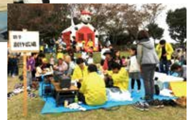
▶しあわせ村 もみじ祭りでの親子創作教室運営支援