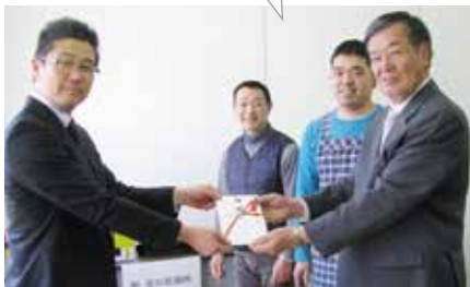
▲ボランティア基金による寄付

ボランティア基金とマッチングギフトプログラムによる会社からの寄付を合わせて各団体が希望する物品を寄付しました。