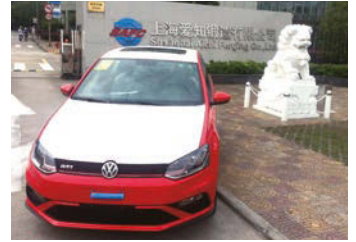
▲2016年度副賞として贈られた フォルクスワーゲン「POLO GTI」

当社海外子会社で鍛造品を幅広く生産する上海愛知鍛造有限公司(本社:中華人民共和国上海市)は、上海フォルクスワーゲン様より、2015年度「優秀サービス賞銅賞(優秀サービス賞銅賞)」、2016年度「優秀サービス賞金賞(優秀サービス賞金賞(サービス部門トップ))」に引き続き、2017年度は400社のうち上位6社に選ばれ「優秀品質賞(優秀品質賞)」を受賞しました。迅速かつ誠実なアフターサービス、物流面での柔軟な対応力や、緊急の増産依頼での対応、設計品の高ネットシェイプ率や品質の高さ、品質クレームゼロを実現した品質維持の取り組みなどがお客様から評価された結果です。